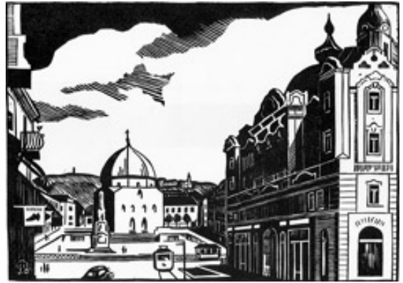
Így látjuk Pécsét (linómetszet)