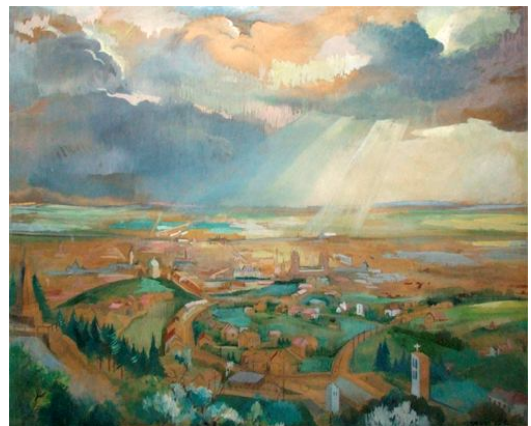
Pécs a Hotel kikeletből (olaj, vászon)

A faliképek mellett olajfestmények, akvarellek is sorra kerültek ki a keze alól. Közel hat évtizedet átívelő munkássága során portrékat, városképeket, tájképeket festett, valamint életképeket alkotott vásári forgatagról, külszíni bányajelenetről, viharról. Az 1960-ban készült, Az Apokalipszis lovasai című alkotása a Magyar Nemzeti Galéria tulajdonában van. A Szépművészeti Múzeum az új magyar képtár számára vásárolta meg egy havas pécsi tájképét. Több alkotását a pécsi Janus Pannonius Múzeum birtokolja.