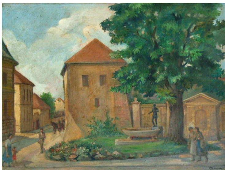
Gebauer Ernő: Pécs – Aranyoskút (1959)

Cím: Mecsekaljai Óvoda és Általános Iskola, Pécs Bánki Donát utca 2. 7633